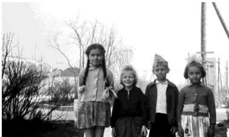
Парк Кировска, 50-ые годы

Помню, что на линейке в школе в день похорон Сталина в 1953 году все плакали, а слово «репрессия» нам было не знакомо. Только в этом году маминым сестрам разрешили уехать с Севера в город Сланцы Ленинградской области. А в нашей семье было уже к тому времени пятеро детей, и трудно было поменять место жительства. Так мы и остались на Севере. Но я не оставила свою мечту переехать в теплые края.