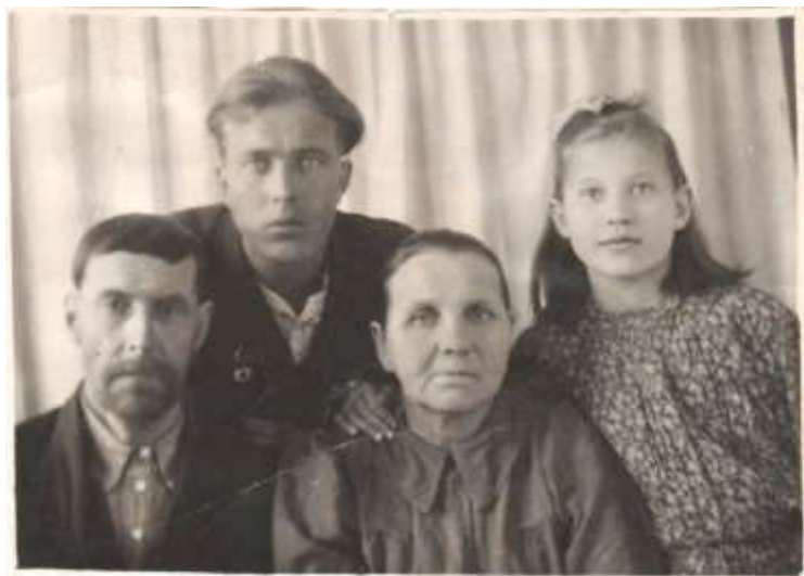
Мои родители, 1950 год