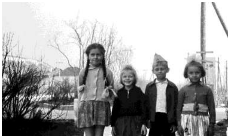
Парк Кировска, 50-ые годы

Помню, что на линейке в школе в день похорон Сталина в 1953 году все плакали, а слово «репрессия» нам было не знакомо. Только в этом году маминым сестрам разрешили уехать с Севера в город Сланцы Ленинградской области. А в нашей семье было уже к тому времени пятеро детей, и трудно было поменять место жительства. Так мы и остались на Севере. Но я не оставила свою мечту переехать в теплые края.